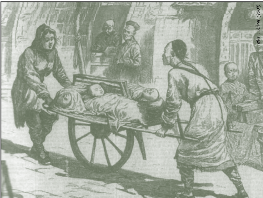
बच्चा साटासाट गर्दै